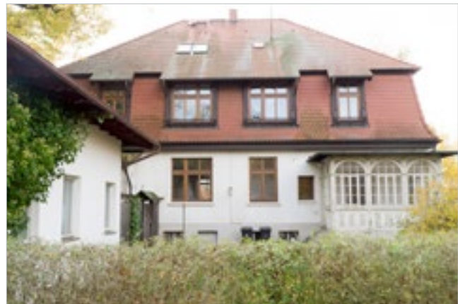
↓ Badepark 16/16a

Weiterhin wurde in 2016 im Kurpark, Badepark 16/16a, eine historische leer stehende Villa mit notariellem Kaufvertrag zu einem Kaufpreis einschließlich Nebenkosten von 179,9 T€ erworben.